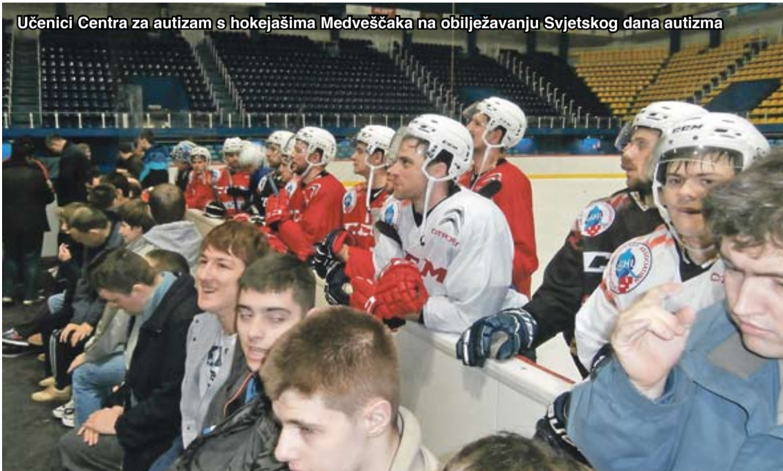
Učenici Centra za autizam s hokejašima Medveščaka na obilježavanju Svjetskog dana autizma

Od suvremene škole usmjerene na uključivanje učenika s PAS-om očekuje se da svakom učeniku omogući da razvija kompetencije, kao i da svakom nastavniku i stručnom suradniku omogući da razvija kompetencije za rad s učenicima s teškoćama te konačno i svakom roditelju da sudjeluje u svim etapama školovanja svog djeteta. Važna je i lista procjene osobitosti školskog učenja, pri čemu treba obratiti pažnju na komunikacijske vještine, brojenje, računanje, mjerenje, praktičan rad, vještinu orijentacije i strategije učenja i sociološke oblike rada. Procjenom se utvrđuje razina razvijenosti unutar